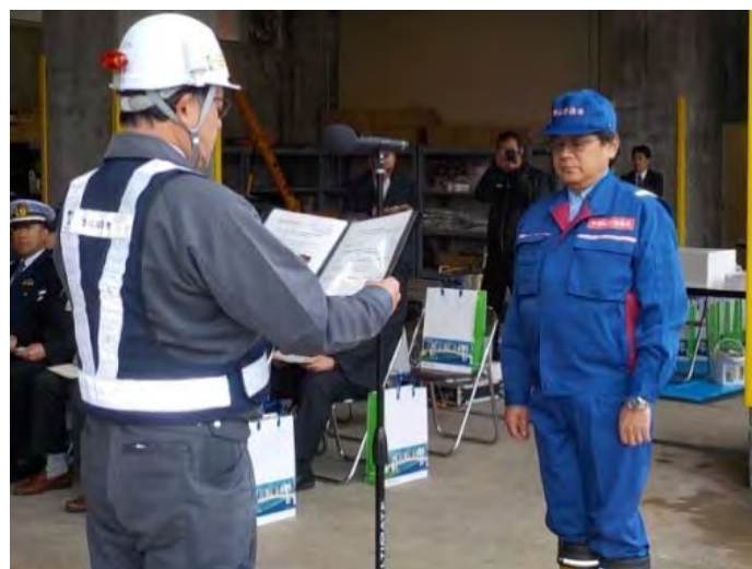
受注者による安全宣言