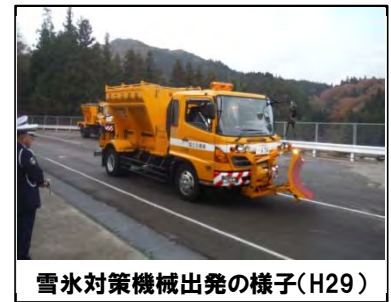
雪氷対策機械出発の様子(H29)