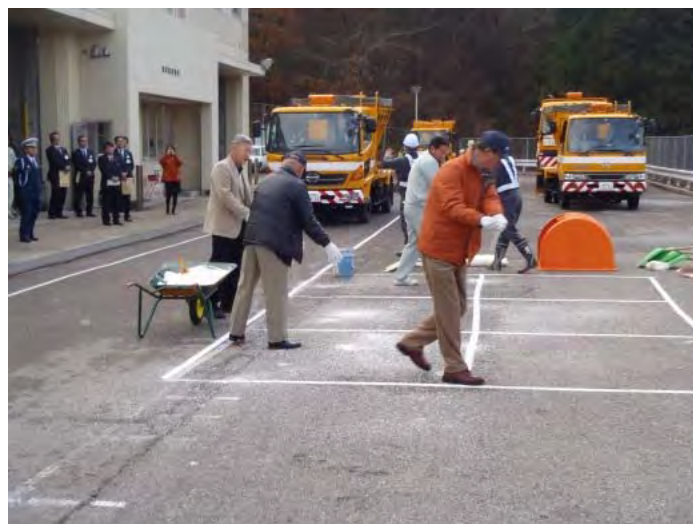
凍結防止剤の手撒き体験