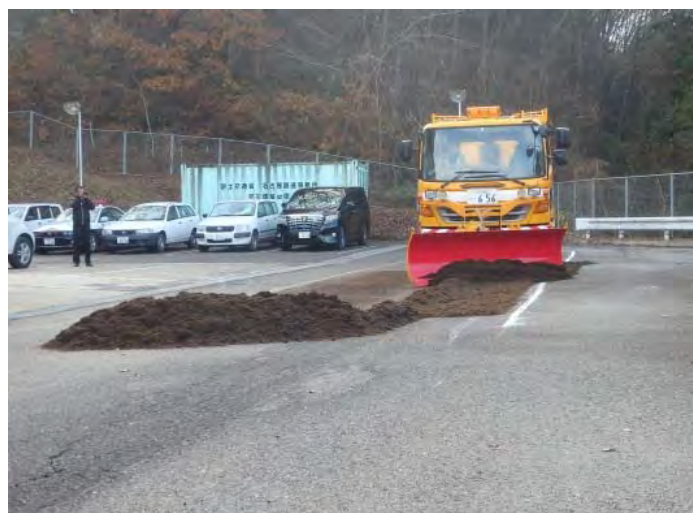
除雪作業のデモンストレーション