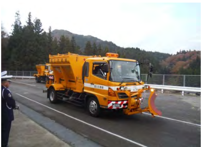
雪氷対策機械出発