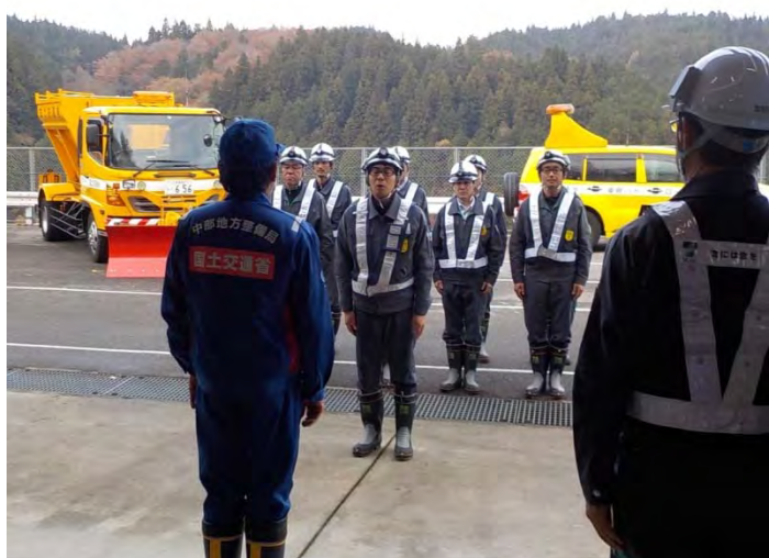
雪氷対策機械安全点検