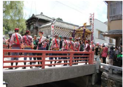
【下田八幡神社例大祭】

国指定史跡「了仙寺」や「玉泉寺」及びその周辺地域と、開国の舞台となった湊町における下田八幡神社例大祭、日米親善と交流を広げる黒船祭等からなる歴史的風致の維持向上を図るため、伊豆石やなまこ壁造りの歴史的建造物の保存修理や、了仙寺周辺の無電柱化や道路の美装化による修復整備、祭りで使用する道具の整備・補修に関する支援等の事業等が位置づけられています。