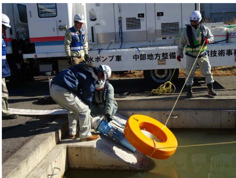
人力で設置・撤去可能