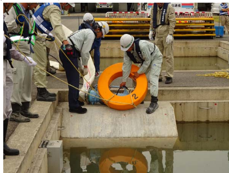
人力で設置・撤去可能