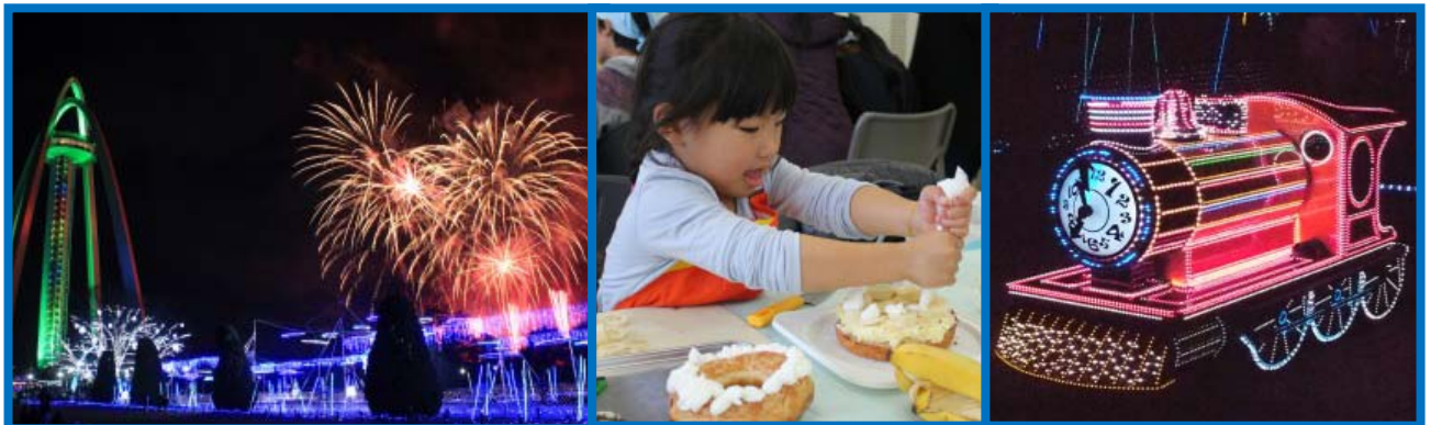
写真は2017年のものです。