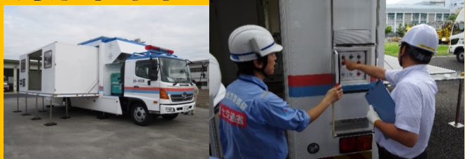
車体拡幅時 操作体験

【問合せ先】 中部技術事務所 総務課 電話：052-723-5701 【アクセス】 地下鉄名城線「ナゴヤドーム前矢田駅」下車1番出口より徒歩1分