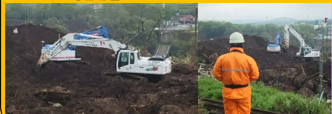
H28熊本地震での作業状況 遠隔操縦状況