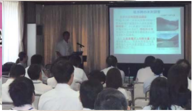
蘭の間 (安全安心、活力)