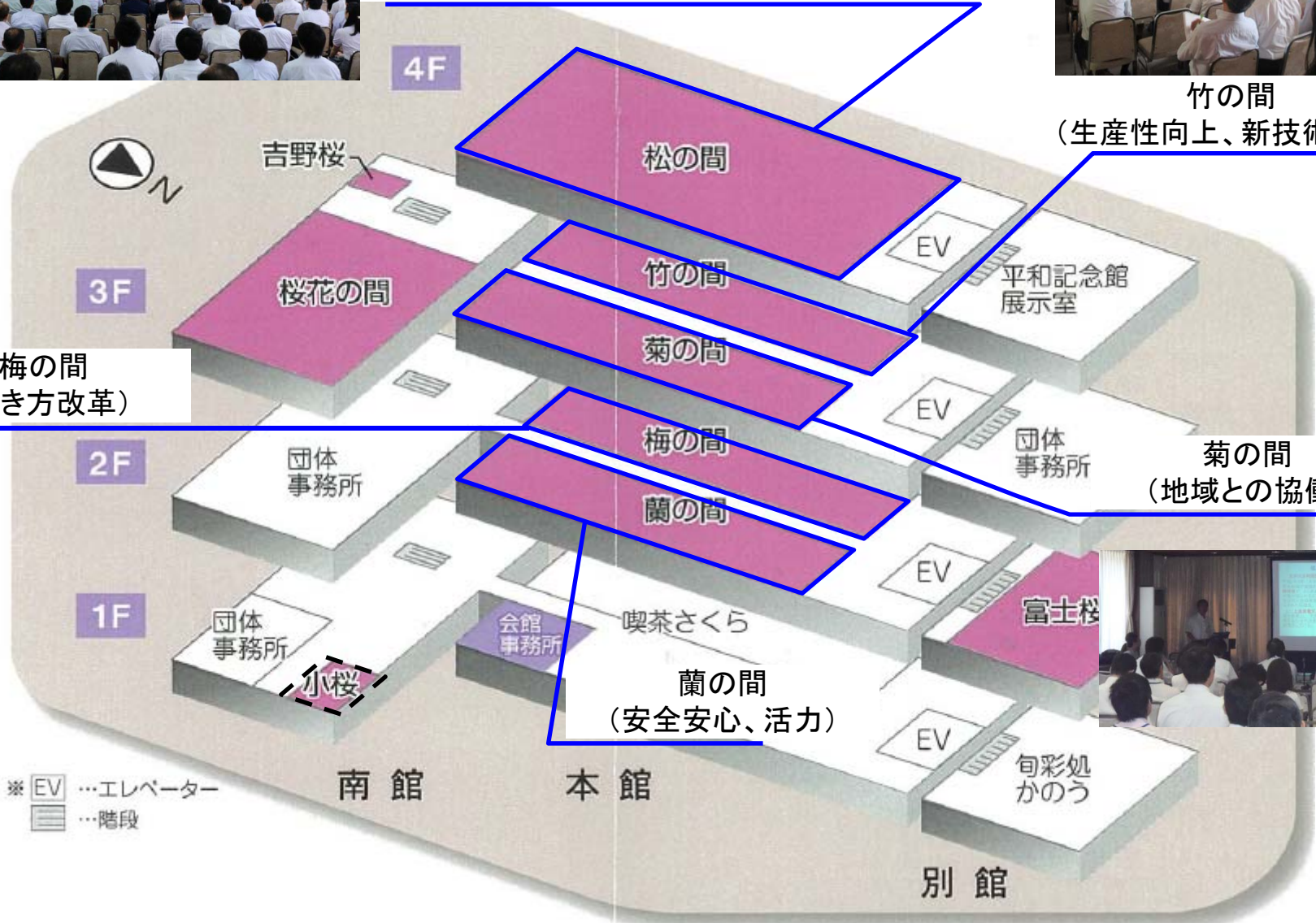
梅の間 (働き方改革)