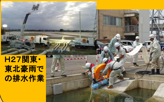
H27関東・東北豪雨での排水作業 操作体験