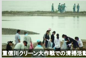
重信川クリーン大作戦での清掃活動