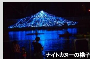
ナイトカヌーの様子