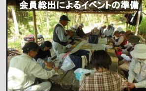
会員総出によるイベントの準備