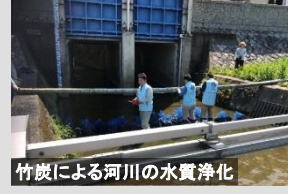
竹炭による河川の水質浄化