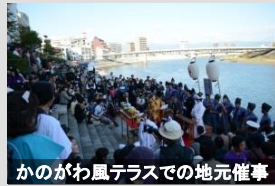
かのがわ風テラスでの地元催事