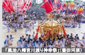
「風治八幡宮川渡り神幸祭」(番田河原)