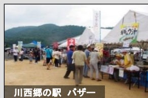
川西郷の駅 パザー