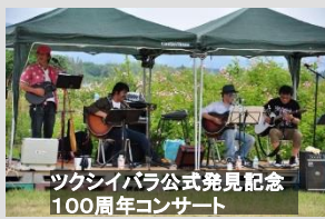
ツクシイバラ公式発見記念 100周年コンサート