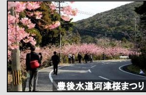
豊後水道河津桜まつり