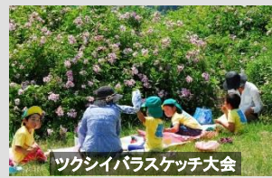
ツクシイバラスケッチ大会