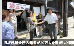
旧坂越浦会所入館者が20万人を達成した瞬間