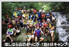
ほしはら山のがっこう 7泊8日キャンプ