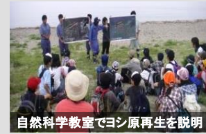
自然科学教室でヨシ原再生を説明