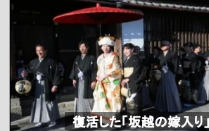
復活した「坂越の嫁入り」