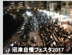
沼津自慢フェスタ2017