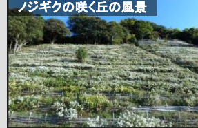
ノジグクの咲く丘の風景