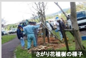
さがり花植樹の様子