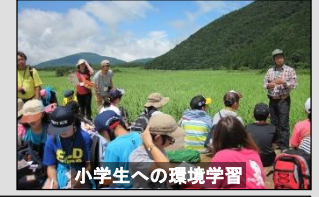
小学生への環境学習