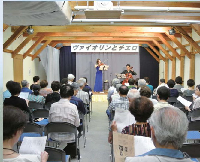
ワンコインコンサート