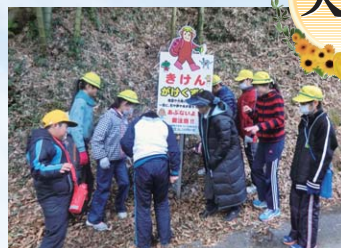
地域を守るのは ぼくらだ! ～学校・地域・関係機関が連携した防災活動～