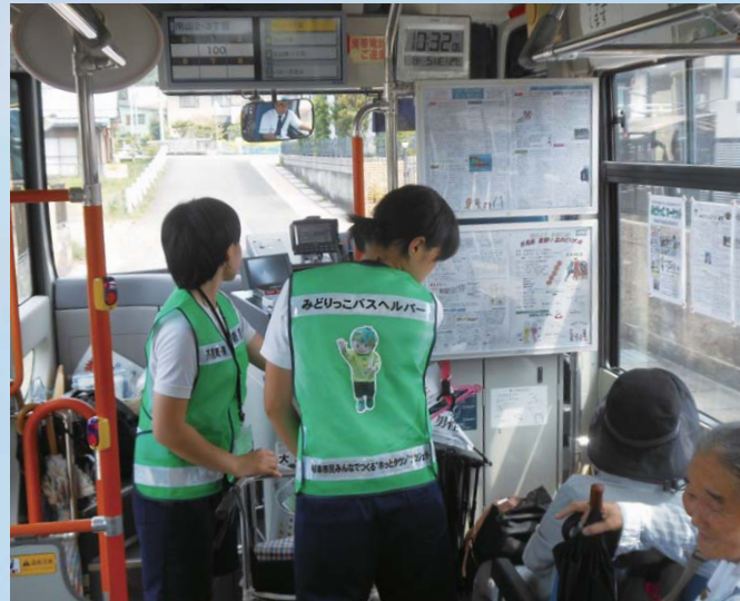
みどりっこバス中学生ヘルパー

趣味の手作りの品を2ヵ月に1回対面販売しています。岐阜市のメディアコスモスでも販売を行いました。