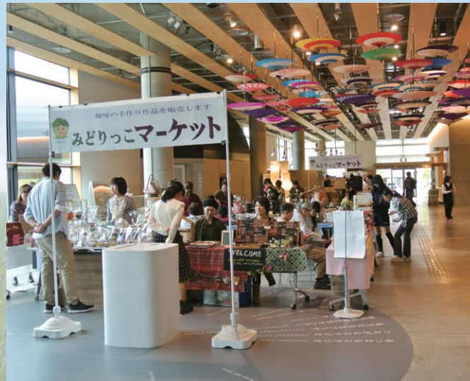
みどりっこマーケット