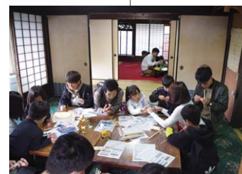
地域に子どもや学生を呼びこむ 古民家再生・黒谷プロジェクト