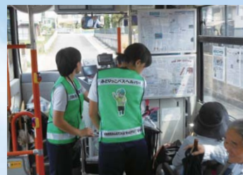
絆をつくるまちづくり