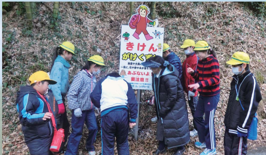
自主防災看板の設置