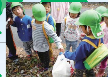
子どもたちが未来を地域を創る主役! 環境教育を楽しむ「保育園のいいむす21」