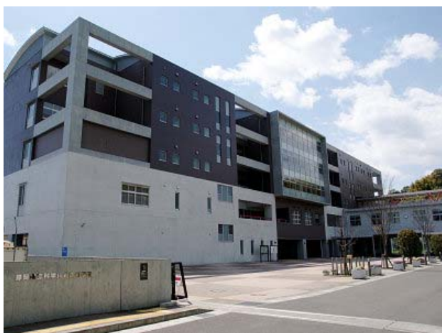
※静岡県立科学技術高等学校ホームページより作成