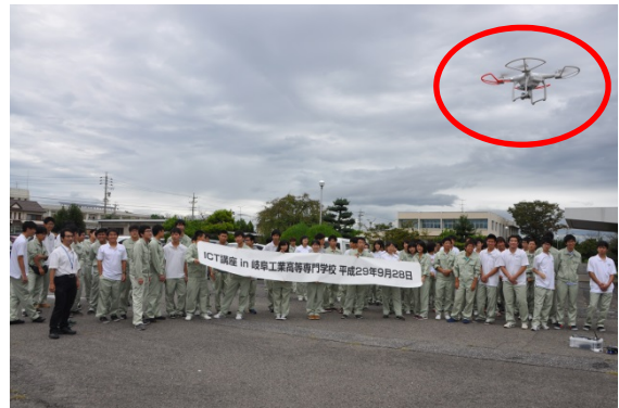
UAVデモンストレーションイメージ

※写真左：三重県立相可高等学校、写真右：岐阜工業高等専門学校でのICT講座の状況