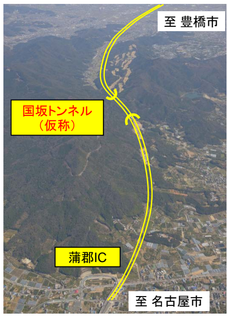
蒲郡ICより豊橋市方面を望む (H28.3月撮影)