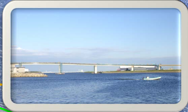
②富双緑地から見た風景