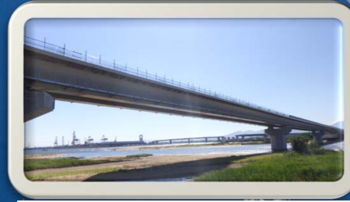
④朝明川（左岸）から見た風景