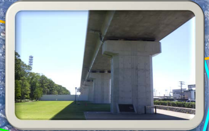
⑤川越緑地から見た風景