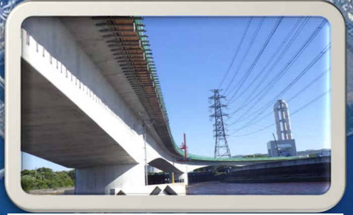
⑥新田水路から見た風景