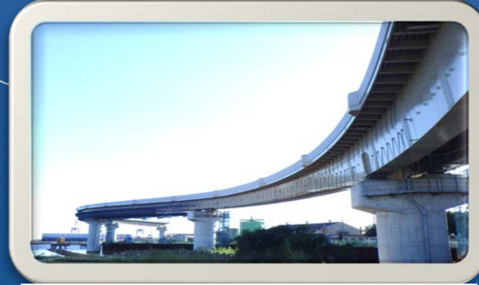
③高松海岸から見た風景