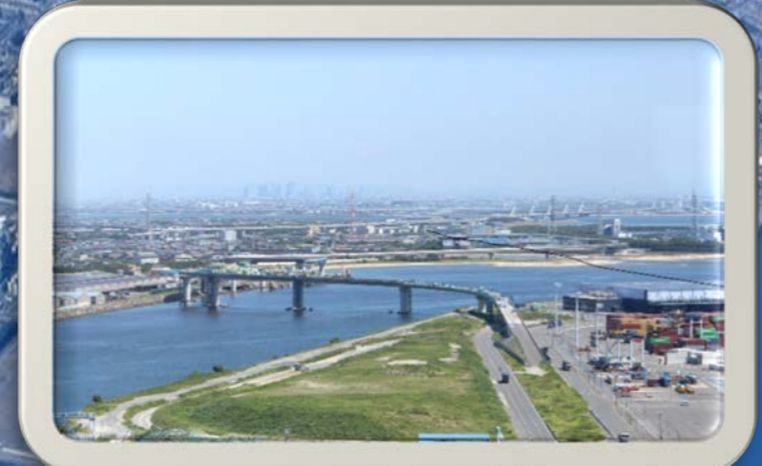
①ポートビル（うみてらす14）から見た風景