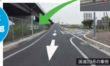
ラバーポール・矢印看板・矢印路面表示を設置