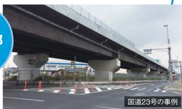
ラバーポールを設置