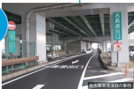
ラバーポール・矢印路面表示・高速出口路面表示・進入禁止看板を設置