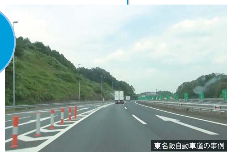
ラバーポール・矢印看板・矢印路面表示を設置