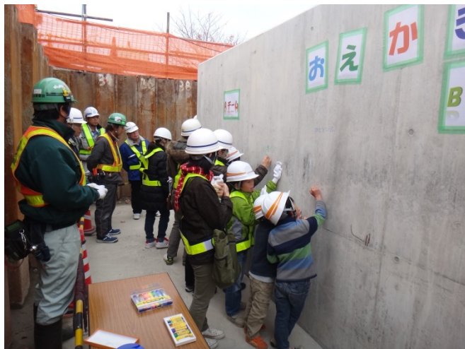
コンクリートに落書きをしている様子