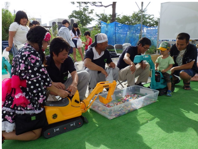
おもちゃ建設機械によるアメすくいの様子