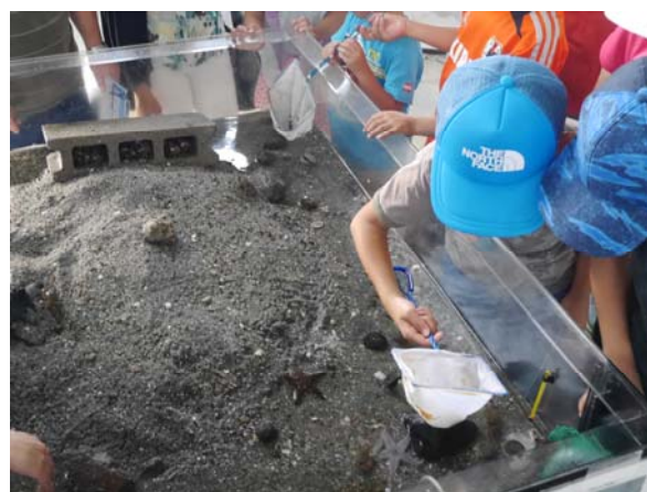
【干潟のタッチプール】