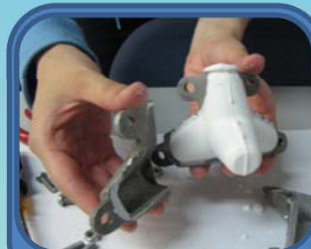
波消しブロックをつくろう