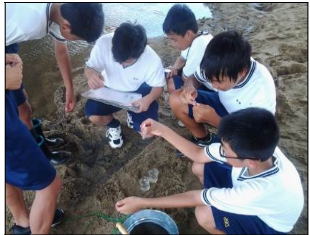
水質調査キットによる調査状況