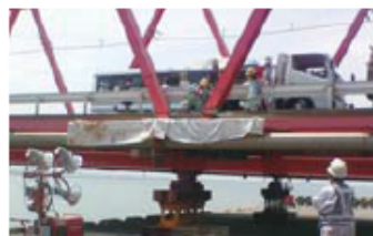
破断が発見された翌日に緊急対策工事に入った