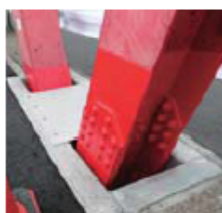
破断部の対応(右で破断部、左は修繕部)