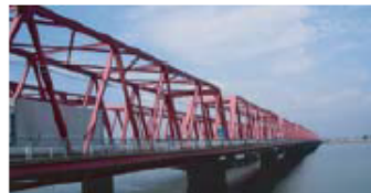
■木曾川大橋 橋長858m 1963年架設