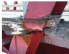
破断した鋼材。上下の両方に分離している