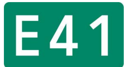
東海北陸自動車道