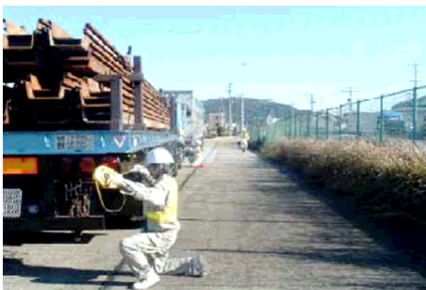
確認状況 (長さの計測)