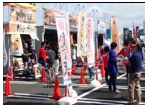
「みなとオアシス」における地域振興イベント