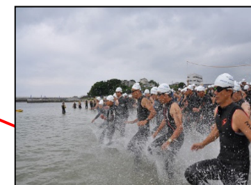
里海トライアスロン(7月)