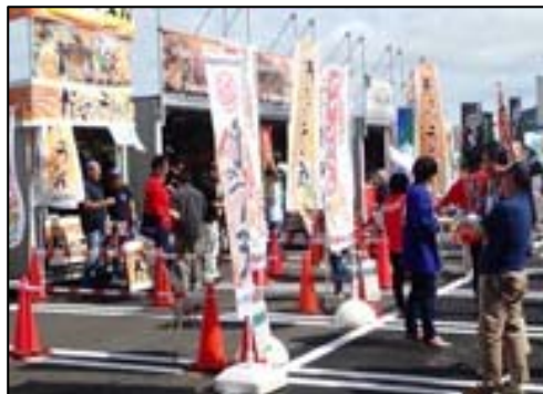
「みなとオアシス」における地域振興イベント