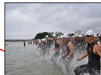
里海トライアスロン(7月)