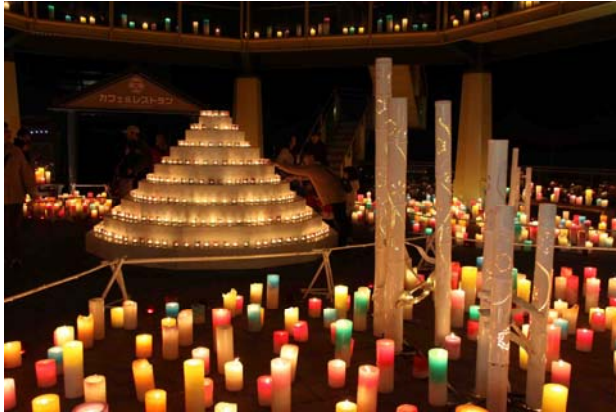
約1,000本のキャンドル展示