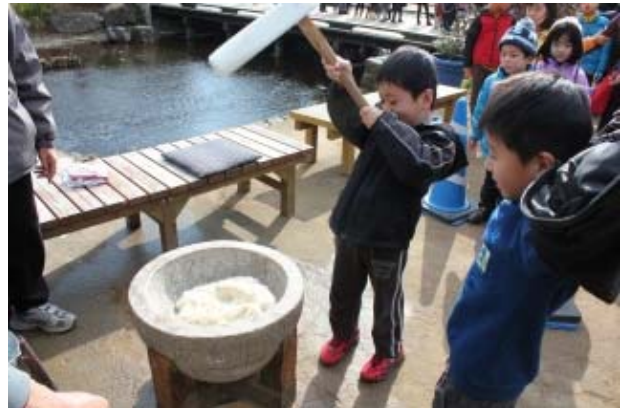
もちつき大会の様子