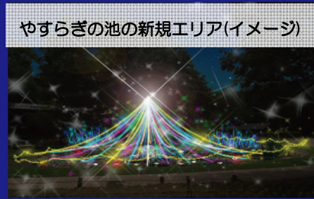
やすらぎの池の新規エリア(イメージ)