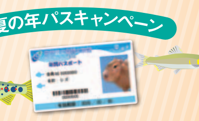
夏の年パスキャンペーン 期間中 年パスを購入または更新で3ヶ月ボーナスプレゼント! 期間: 7/18(土)~8/31(月)

日時: 7/25(土)~26(日)、8/8(土)~9(日) 16:30~翌9:30 料金: 大人: 8,000円 子ども: 6,000円 ※夕朝食付き 対象: 小学生とその保護者 25名 締切: 各開催日の2週間前※ハガキまたはHPから応募