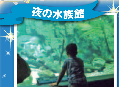
夜の水族館 閉館後の水族館を特別にご案内!

日時: 7/4(土)、30(木)、8/4(火)、8/19(水)、8/28(金) 16:30~20:30 料金: 高校生以上: 4,000円 中学生以下: 3,300円 定員: 40名 ※夕食付き 締切: 各開催日の2週間前※ハガキまたはHPから応募