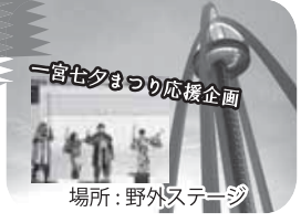
一宮七夕まつりの応援企画

7/18(土) 16:00～20:00 一宮七夕まつりのPRに、ミス七夕・ミス織物や いちみんなも遊びに来よう!その他に、市民の皆 様による音楽ステージイベントを開催します!