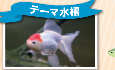
「金魚の夏」 期間: 7/14(火)~8/30(日) 料金: どなたでも無料

日時: 7/4(土)、30(木)、8/4(火)、8/19(水)、8/28(金) 16:30~20:30 料金: 高校生以上: 4,000円 中学生以下: 3,300円 定員: 40名 ※夕食付き 締切: 各開催日の2週間前※ハガキまたはHPから応募