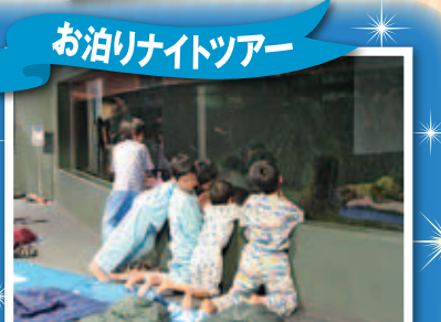
お泊りナイトツアー 夜の見学後、水槽の前で一晩過ごします。

日時: 7/25(土)~26(日)、8/8(土)~9(日) 16:30~翌9:30 料金: 大人: 8,000円 子ども: 6,000円 ※夕朝食付き 対象: 小学生とその保護者 25名 締切: 各開催日の2週間前※ハガキまたはHPから応募