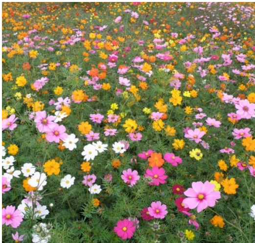
コスモスの見頃は9月下旬～10月上旬