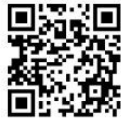
堆肥配布場所 QR コード