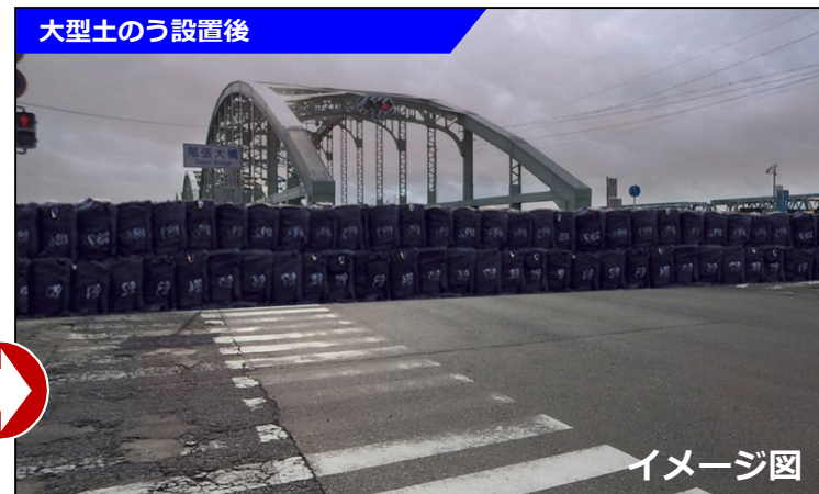
大型土のう設置後