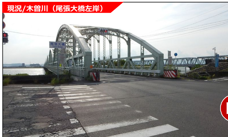
現況/木曾川 (尾張大橋左岸)