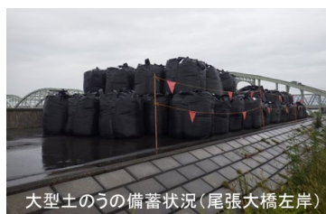
大型土のうの備蓄状況(尾張大橋左岸)