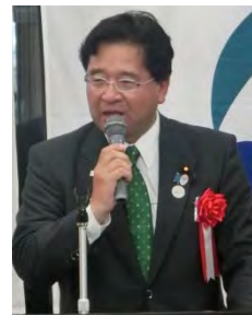
桜井衆議院議員 ＜祝辞＞