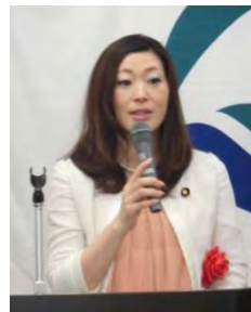
吉川参議院議員 ＜祝辞＞