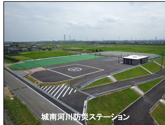
城南河川防災ステーション

○災害時に必要となる土砂等の備蓄や水防活動の拠点となる河川防災ステーションを整備し、防災・減災対策を推進。 ○国において整備する水防活動スペース、備蓄土砂等の基盤整備、桑名市による防災センターが完成したことから、地元国会議員、市長、県議会議員、市議会議員、地元住民等参列のもと、「城南河川防災ステーション・桑名市城南河川防災センター」完成式を開催した。