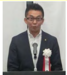
伊藤桑名市長 ＜謝辞＞