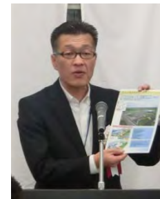
澁谷木曾川下流 河川事務所長 ＜事業報告＞