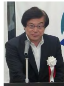
八鍬中部地方整備局長 ＜式辞＞