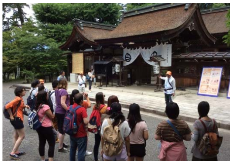
治水工事の話や参拝の仕方を教わりました (治水神社)