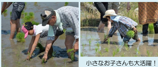
小さなお子さんも大活躍！