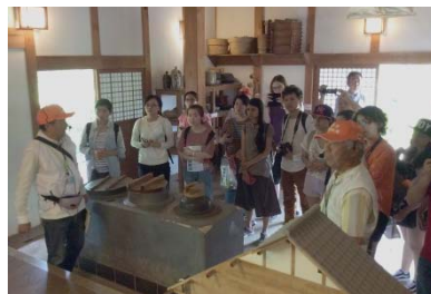
輪中の農家を見学(木曽三川公園センター)