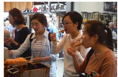
人気の串カツをほおぼる(千代保稲荷神社)