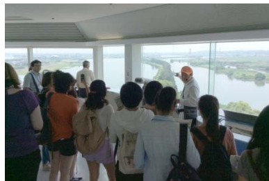
展望タワー(木曽三川公園センター)