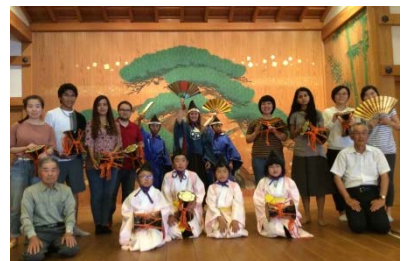
鼓の体験。小学生に鼓のたたき方を教わりました(海津市歴史民俗資料館)