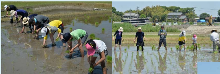
← 一列に並んで植えていきます