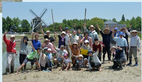
↓みんなで記念撮影。お疲れ様でした！