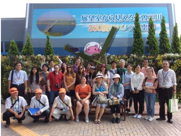
全員で記念撮影(木曽三川公園センター)