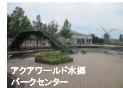
アクアワールド水郷パークセンター