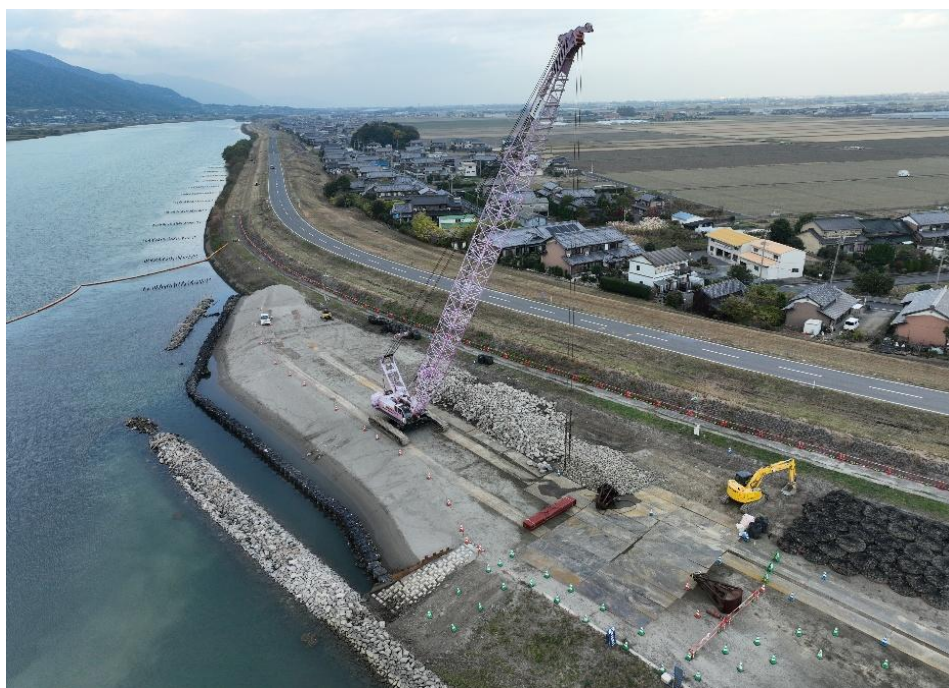
揖斐川左岸16.8k付近より上流を望む