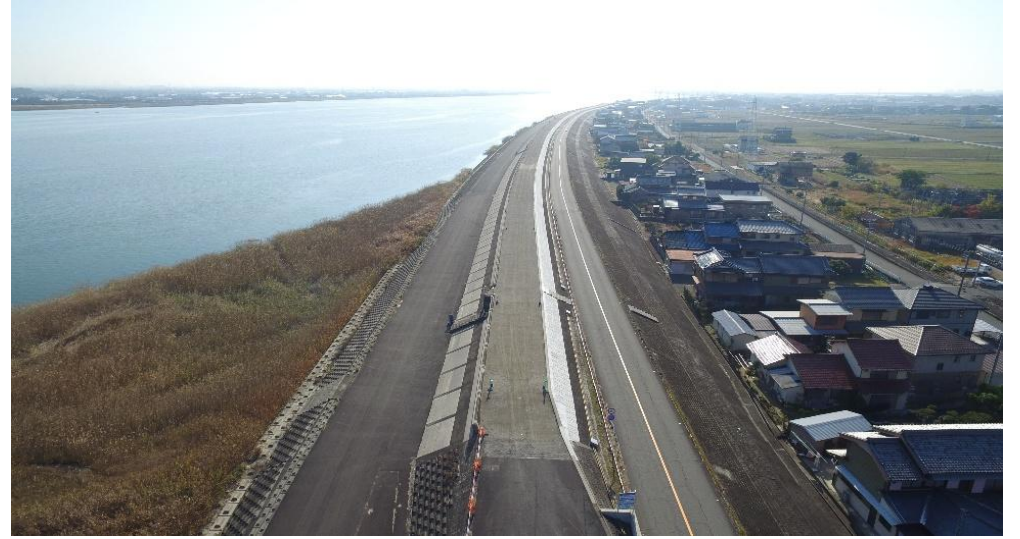
工事終点～下流を望む