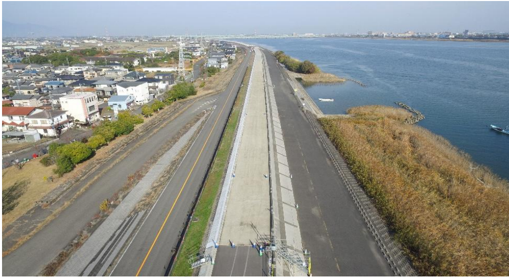
工事起点～上流を望む