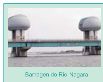
Barragem do Rio Nagara

Todos os operadores de embarcações deverão obedecer a restrições de navegação (velocidade de 2 nós ou menor) nas zonas de navegação dentro de 100 m a montante e a jusante da área aquática restrita que se estende de 200 m a montante da barragem do Rio Nagara até 250 m a jusante da barragem.