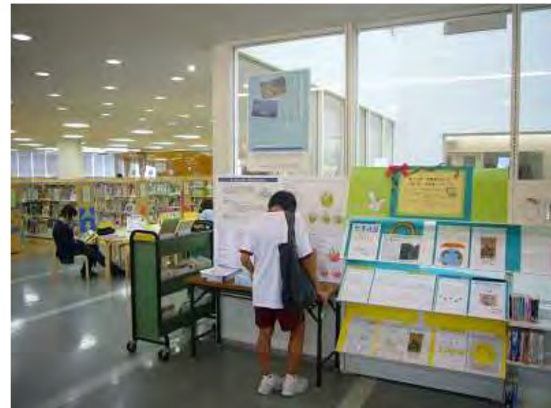
桑名市図書館(メディアライブ)