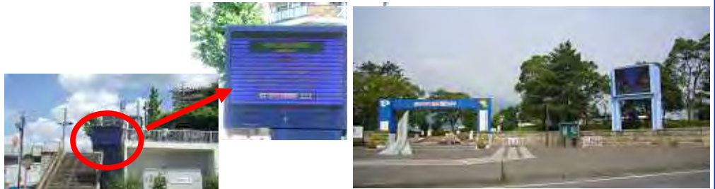
鵜飼乗船場前広場

～ご意見募集中～ これからの木曽川・長良川・揖斐川の川づくりについての意見を募集しています！