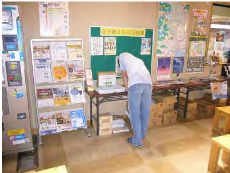
道の駅(月見の里 南濃)