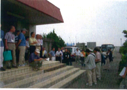
現場巡視 (揖斐川右岸-0.2k 城南排水機場)