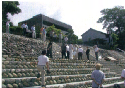
現場巡視 (長良川右岸53.2k 鶺鴒広場)