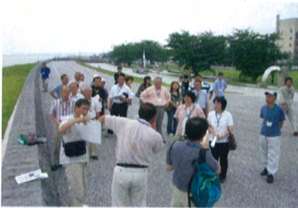
現場巡視 (揖斐川右岸4.2k 吉之丸地区高潮堤)