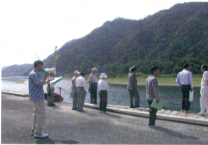
現場巡視 (長良川右岸53.2k 鶺鴒広場)