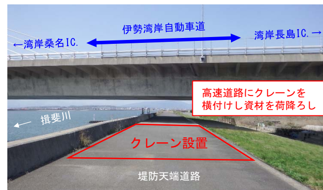
伊勢湾岸自動車道と揖斐川堤防道路の立体交差点部 (揖斐川左岸-0.2kp付近)