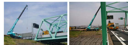
H27訓練時の様子（東名阪国道/木曾川右岸）