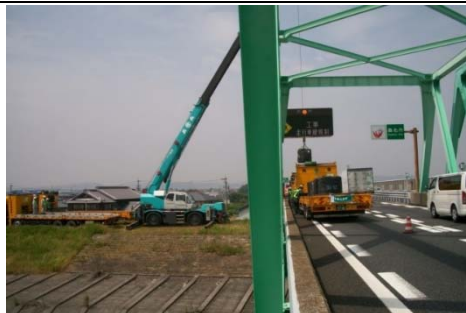
高速道路からの資材搬入イメージ（平成27年 東名阪自動車道での訓練の様子）