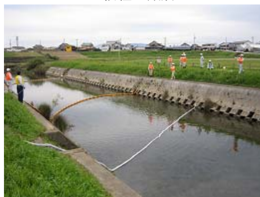
オイルフェンス設置