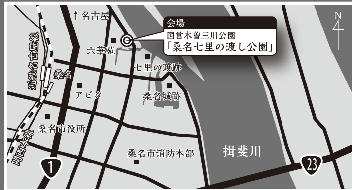
国営木曾三川公園 桑名七里の渡し公園 (桑名市住吉町～太一丸地区(六華苑南側))

9月 21日(金) 18:00-20:00 22日(土) 10:00-20:00 23日(日) 10:00-16:00