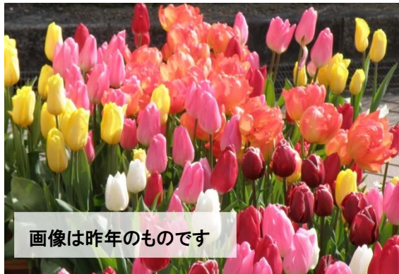
画像は昨年のものです

「白雪姫」をテーマに、南ゾーンいっぱいアイスチューリップを飾り、白雪姫の物語シーンをフォトスポットとし5カ所設置いたします。ぜひ、カメラを持って、遊びに来てください。