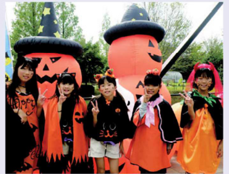
詳しくはアクアワールド水郷パークセンター TEL.0584-53-7200 まで ※予約が必要なプログラムがあります。