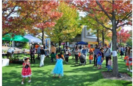
昨年の海津マルシェの様子