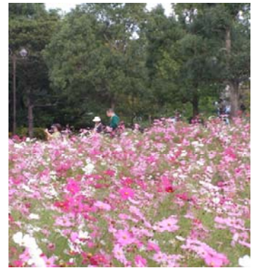
コスモスの見頃は 9 月下旬～10 月中旬