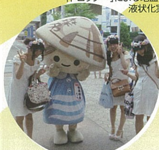
「ドロッチー」による地盤のどろどろ 液状化実験