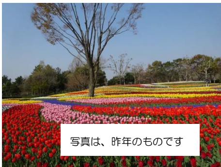
写真は、昨年のものです

高さ 65 メートルの展望タワーからは、木曾三川をデザインした大花壇や、ミッフィーの花絵花壇が一望できます。 ※現在、木曾三川公園センターでは「春こいフェス」(3月29日まで)も開催しています。