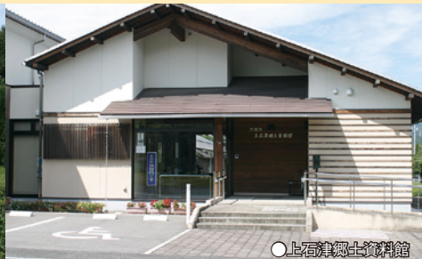
●上石津郷土資料館