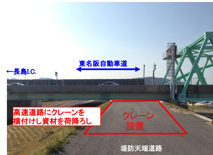
東名阪自動車と木曾川堤防道路の立体交差点部 (木曾川右岸9.6kp付近)