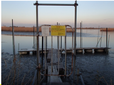
橋梁の放置場所 揖斐川右岸6.6k+160m (桑名市大字上之輪新田地先)