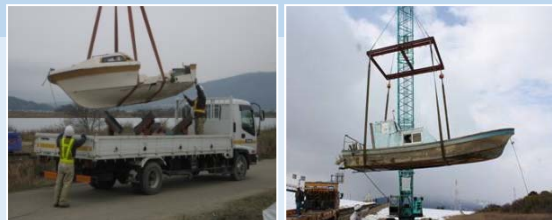
代執行の実施の様子（左：H22 下坂手変形護岸 右：H23 西川地先）