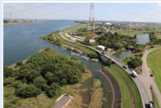
桑名市長島町西川地先から船頭平開門木曾川水路