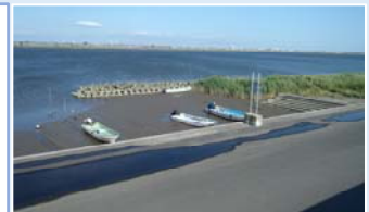
土砂堆積した変形護岸