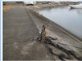
係留杭の設置による護岸損傷