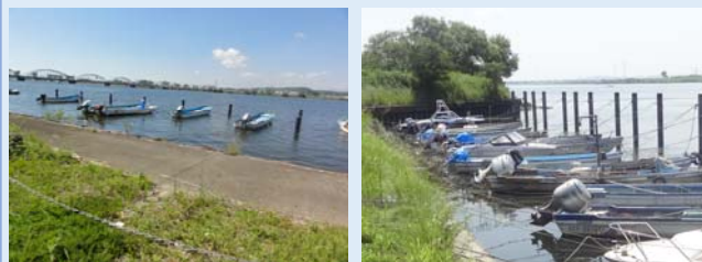
変形護岸と係留許可船舶の状況