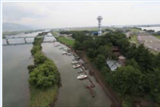
海津市海津町油島地先