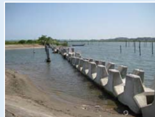
変形護岸の締め切り(下坂手)