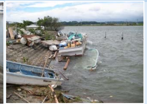
出水による船舶の転覆