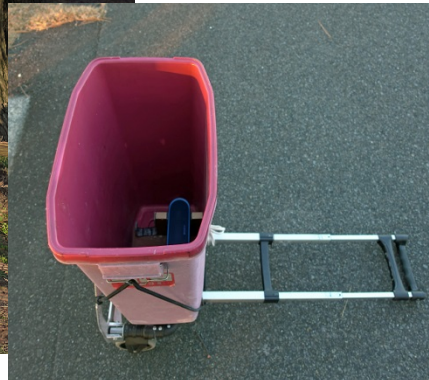
スピーカーで鷹の鳴き声を流しながら巡回 (H29.12.22撮影)