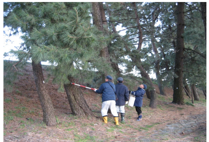
国土交通省職員による巡回 (H30.1.10撮影)