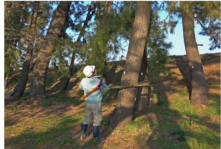
(株)大橋工務店による巡回 (H29.12.22撮影;営巣している松を叩いて追い払い)