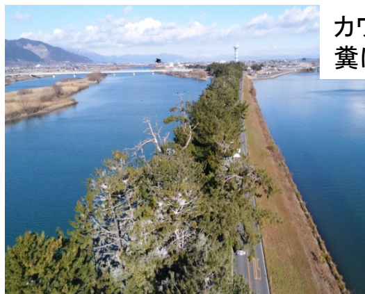
カワウの営巣状況(H30.1.11撮影) 糞により白色化している部分がカワウの巣