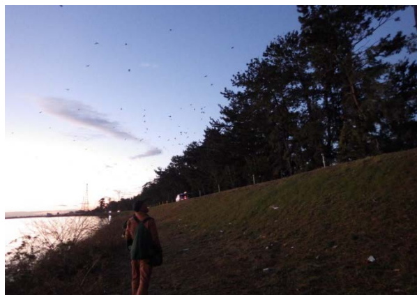
鷹の飛来に驚き逃げ惑うカワウの様子(H29.12.21撮影)