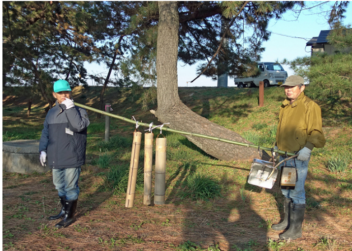
「木曽三川 千本松原を愛する会」による巡回 (H29.12.22撮影;音を出して追い払い)