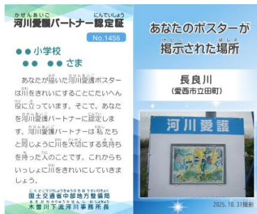
河川愛護パートナー認定書