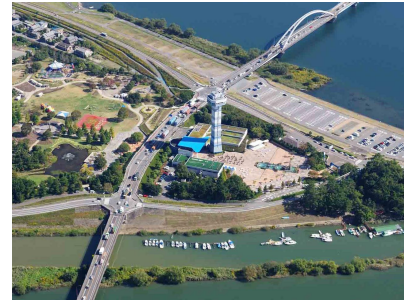
国営木曾三川公園センター 水と緑の館