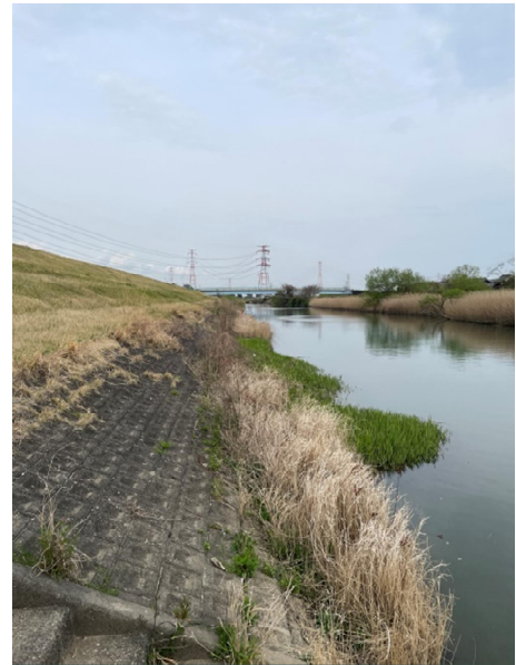
同じく下流方向で船着き場もなく河川として良い状態です。