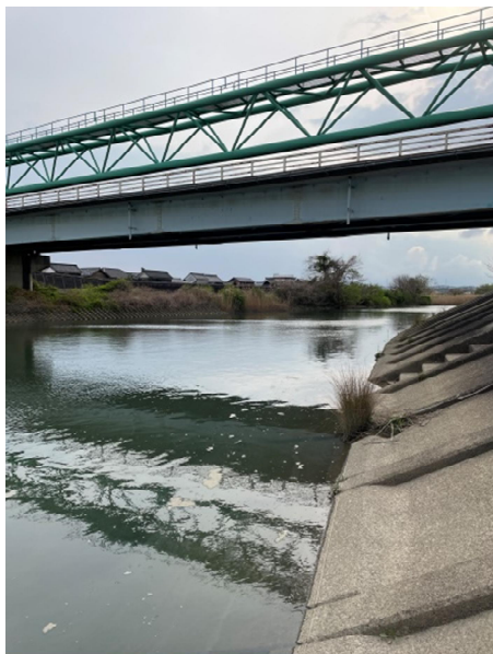
二郷橋以前は護岸に船が放置されていました。多度川はこれで不法施設不法な船の無くなり、災害時対策が完了しました。